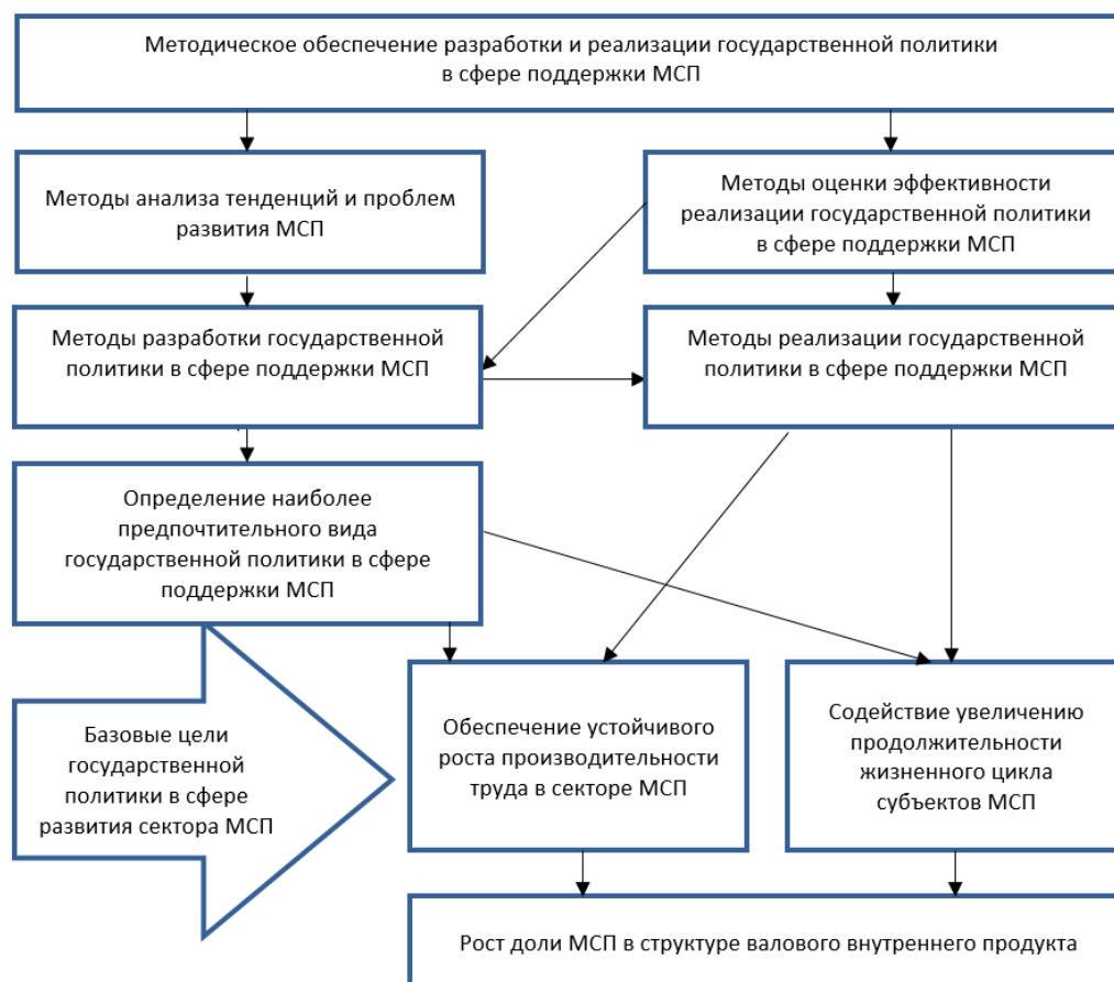
Рис. 2. Основной контур сочетания методов разработки и реализации государственной политики в сфере поддержки МСП и базовых целей его функционирования

нимательства непосредственно зависит от рациональности сочетания методов обоснования и реализации такого рода политики. Общий контур сочетания подобных методов представлен на рис. 2.