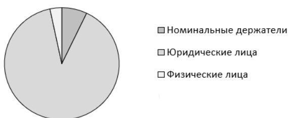
Рис. 2. Держатели акций ПАО «ТНС энерго Ярославль» на 1 января 2026 г. (в %)

Держателями акций на 1 января 2026 г. выступают номинальные держатели – 7,13%, юридические лица – 89,54%, физические лица – 3,33% (рис. 2).