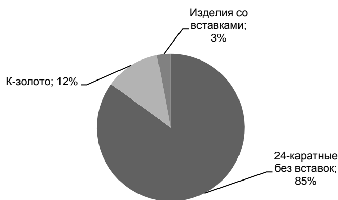
Рис. 2. Структура потребительского спроса на золотые ювелирные изделия по виду используемого сырья на внутреннем рынке КНР

вотного года (лошади, тигра или дракона). Эти пластинки ценятся и как способ вложения денег, и как произведения искусства. Китайцы считают 24-каратное золото в некотором смысле деньгами – слова «деньги» и «золото» в китайском языке обозначаются одинаковым иероглифом. Потребители, покупающие простые изделия из 24-каратного золота, убеждены, что они одновременно покупают и ценность, которая служит средством накопления и сохранения денег, и объект, который можно использовать как украшение.