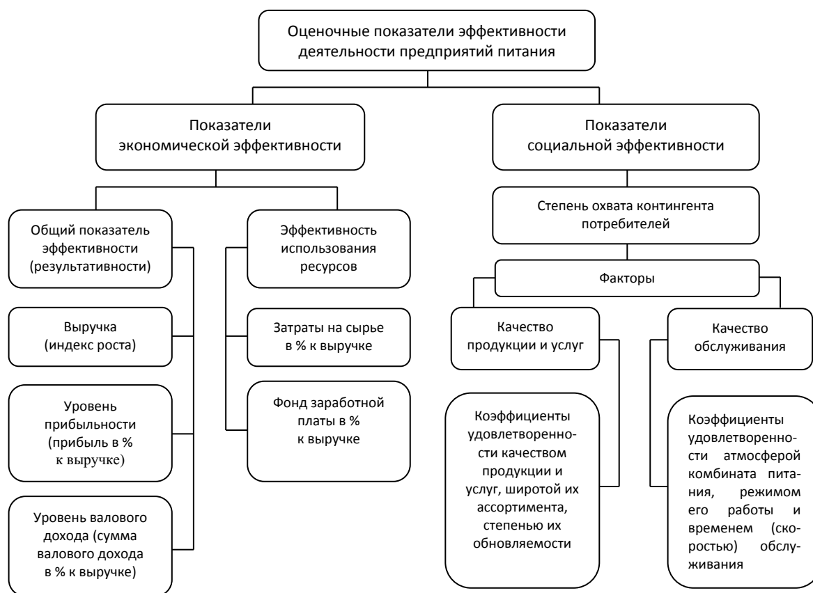
Рис. 2. Оценочные показатели эффективности деятельности предприятий питания

- отсутствие системы финансово-управленческого учета на предприятиях питания вузов осложняет решение проблемы расчета полной себестоимости продукции и услуг и прибыли как конечного финансового результата их деятельности.