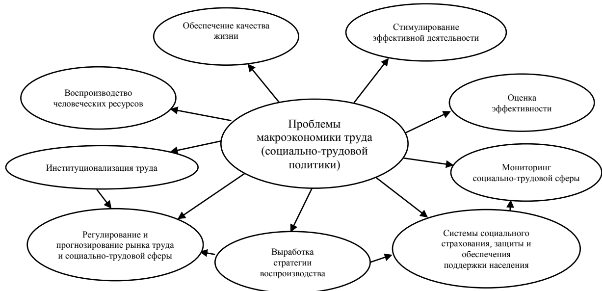
Рис. 1. Проблемное поле макроэкономики труда

Так, предметом макроэкономики труда являются проблемы рынка труда, выработка стратегии и политики развития социально-трудовой сферы и ее регулирования, воспроизводство рабочей силы, прогнозирование трудовых и социальных показателей развития экономики, в том числе подготовка кадров, уровень и качество жизни населения и их мониторинг (рис. 1).