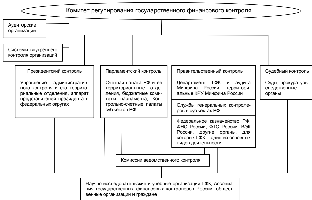
Рис. 2. Предполагаемая структура системы органов ГФК и ее взаимоотношения с органами негосударственного контроля (принципиальная схема)

Но основная роль при этом все же отведена регламентированной законодательством деятельности специальных государственных контрольных органов (рис. 2). Такие органы целесообразно разграничивать в соответствии с их компетенциями (рис. 3).